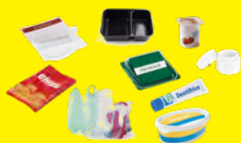
Pots, boîtes, barquettes, sachets, films, tubes...