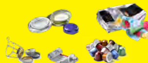
Capsules, sachets, boîtes, tubes, opercules...