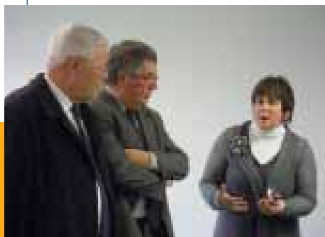
À Marquise, l'EHPAD «La Sainte Famille» va bientôt proposer un espace d'éveil sensoriel grâce à l'implication des élus

Cette collaboration est officielle depuis la signature d'une convention de partenariat au mois de janvier. L'objectif est d'apporter aux aidants des solutions afin de les accompagner le mieux possible au quotidien, et de mettre en place des actions de formations communes pour le personnel des deux structures.