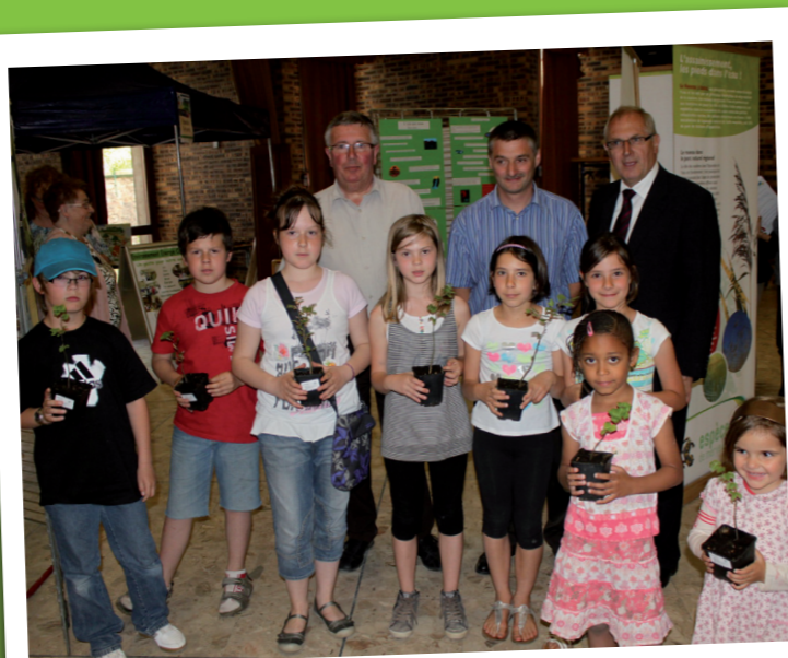
Les enfants d'aujourd'hui plantent les arbres de demain ...